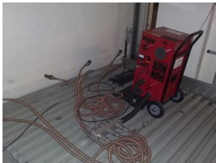
Kombinationsmaskiner... Kondens og adsorption i samme maskine