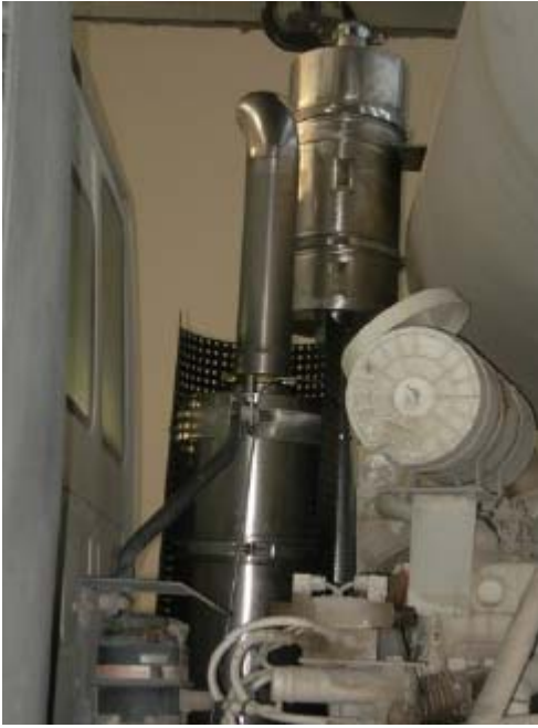
IVECO TRAKKER VERT