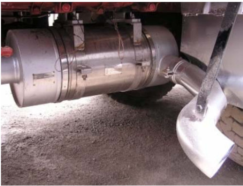
IVECO MAGIRUS 260