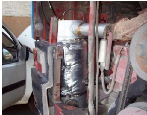
IVECO 370 L25 L30