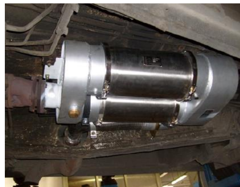
SETRA S300 NC