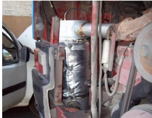
IVECO 370 L25 L30