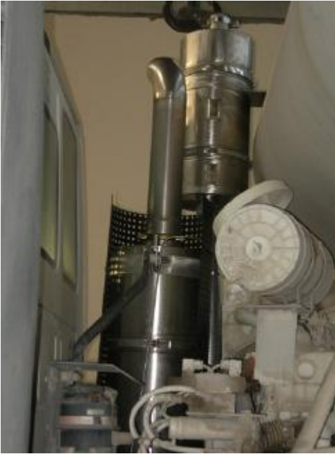
IVECO TRAKKER VERT