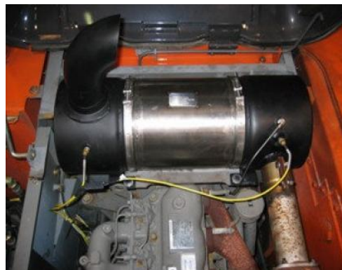
PALA ZAXIS 210N