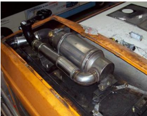
BREDA MENARINI M220 E