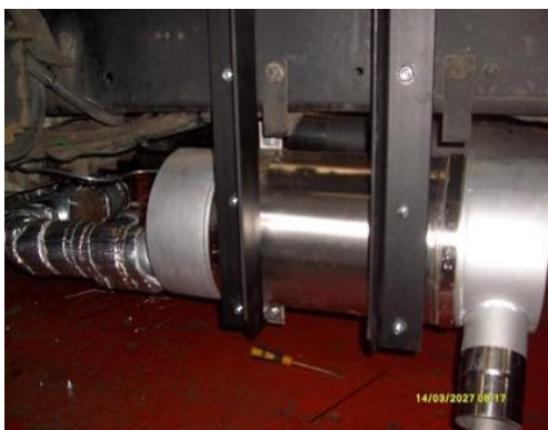
DAF 95.430 EURO 2