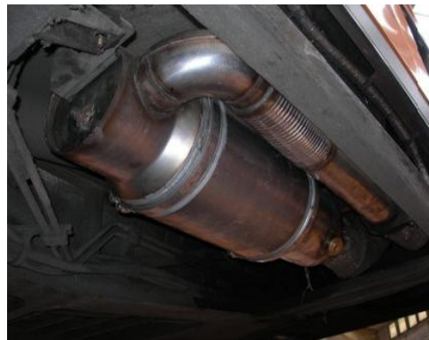
IVECO 491.12 EURO 2