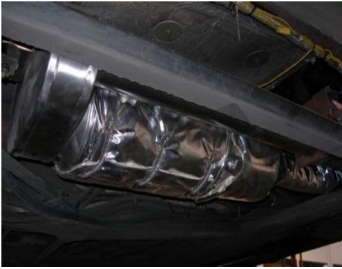
IRISBUS 491.18 EURO 3