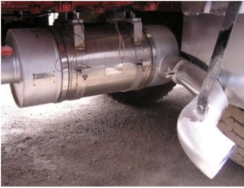
IVECO MAGIRUS 260