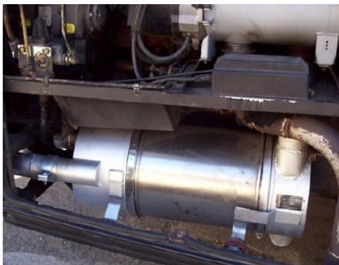
MERCEDES O 303