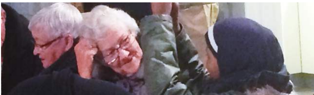
Snakken gik, og der blev etableret nye relationer på workshoppen.

Ud over konkrete ideer blev der etableret ikke bare en interesse i at starte aktiviteter på tværs af generationer og interesser. Der blev også opbygget en forståelse for hinanden. Og det er en god start for indsatsen i Varmehallen.