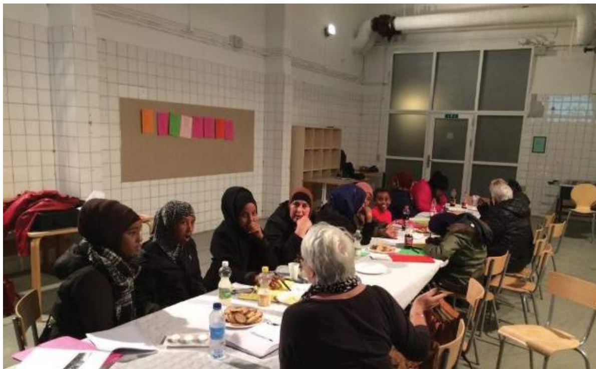
Beboerne kom med mange nye forslag til Varmehallens fremtidige brug.