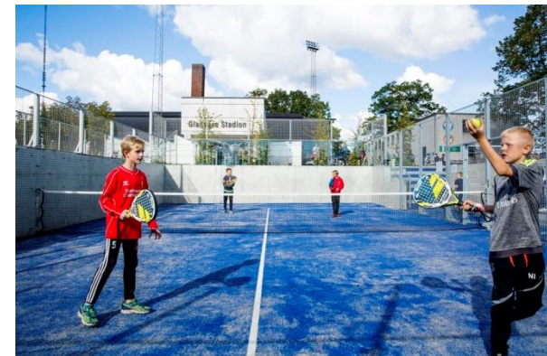
Vand på sidelinjen, Gladsaxe