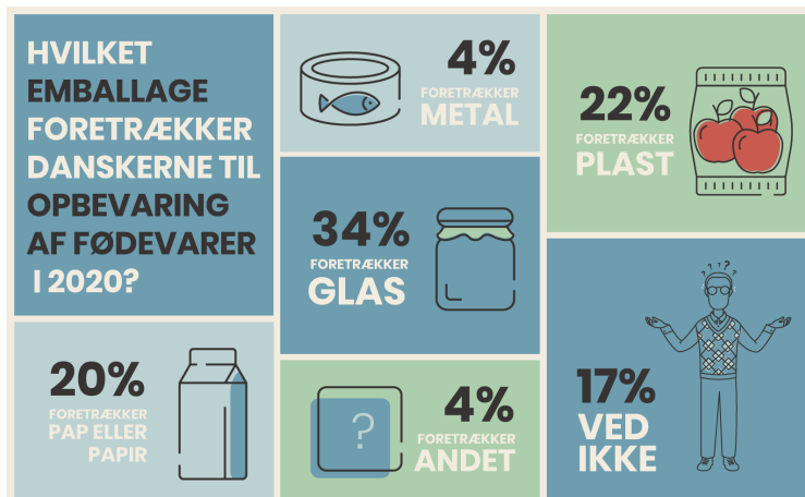
Figur 2: Forbrugernes holdninger til hvilket emballagemateriale de foretrækker (kilde: Plastindustrien, 2020)

Deltagerne blev fundet via et eksternt bureau (Userneeds). Her blev 212 forbrugere spurgt; disse var et