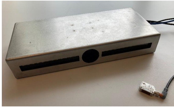
Kamerakasse set forfra med knivpositionssensor.