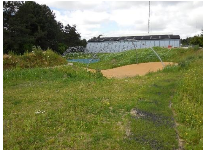
Figur 3: Svingkarusellen.

Svingkarussellen: Skålen under svingkarussellen har en volumen på 100 m 3 . Den udgør det laveste og første bassin af de i alt fem bassiner i Caféhaven. Caféhaven kan samlet håndtere en 10-års hændelse. Når det regner, vil vandet fra de omkringliggende tagoverflader blive opstuvet i skålen til en højde på 10-20 cm via en pop op-rist i bunden af bassinet, som også udgør skålens dræn. Med svingkarussellen er vandet tænkt ind i den rekreative funktion. I stedet for midlertidigt at umuliggøre den rekreative funktion, vil regnvandet styrke legens fascinationskraft.