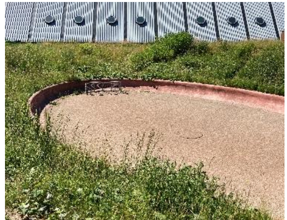
Figur 5: Gadefodboldbanen.

Gadefodbold: Det sidste bassin er designet som en lille, eksperimenterende bane til gadefodbold for 2-3 spillere. Banen er formet som en superellipse og giver bolden et uforudsigeligt tilbagespring. Bassinet har et samlet volumen på 60 m 3 med en gummi-asfaltbund og kanter af ferrocement. I bunden af bassinet er der en pop op-rist, som lukker regnvandet ind i forbindelse med større regnhændelser, og som efterfølgende tillige fungerer som bassinets dræn.