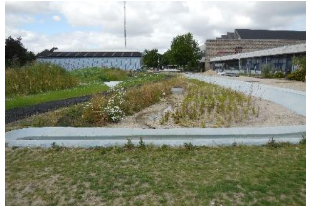
Figur 9: Rensesøen ved Vandlegepladsen,

Rensesøen ved vandlegepladsen: Der er bentonit i bunden for vandet skal kun renses gennem filterjorden og løbe videre til vandlegepladsen. Bunden er dog ikke tæt, så der er ikke vand nok til vandlegepladsen. Der er tanke under jorden til rensning af vandet, men pga. COVID-19 har de ikke været i brug i to år. Lige nu bruges drikkevand til vandlegepladsen.