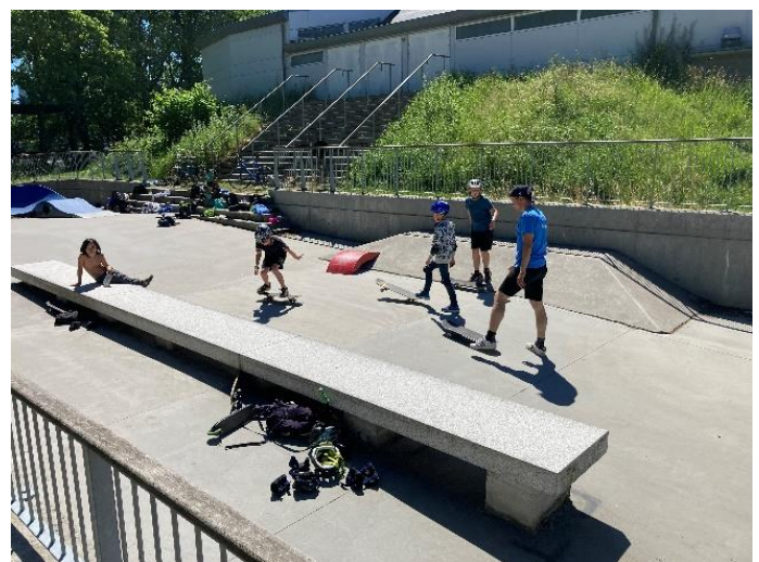
Figur 6: Skatebaljen.

Skatebaljen er et bassin ved skøjtehallen, som er udformet som et aflangt betonkar med en bredde på 8 meter, der strækker sig i hele skøjtehallens længde på 80 meter. Bassinets midterste del har en cirka 20 meter lang vandret flade, som efter ønske fra ishockeyklubben kan anvendes til skudtræning for ishockeyspillere. Med tykke betonvægge og betongulv kan bassinet i frostvejr overrisles og anvendes som en udfordringsbane til skøjteløb. De let skrånende flader udstyres med tricks og ramper, der kan flyttes og fikseres, alt efter brugernes ønsker og input.