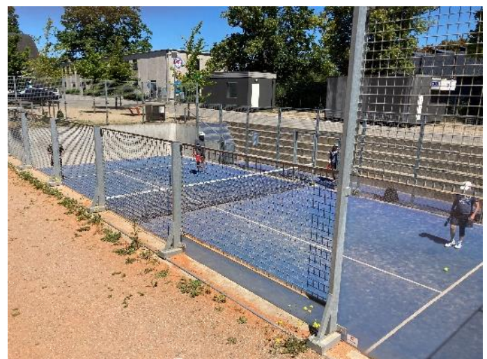
Figur 7: Padel tennisbane

Padel tennis: Det ene af de to sidste bassiner i systemet, er et regnvandsbassin til forsinkelse, der er designet som en padel tennisbane med tilhørende tribune til tilskuere. Bassinet fyldes med regnvand i skybrudssituationer som sidste bassin i et større system sammen med Pigeværelset. Bassinet er placeret ved siden af tennisbanerne på Gladsaxe Stadion og er udformet, så det med sine 15 x 20 meter og et banelegeme på 10 x 20 meter lever op til internationale standarder for padel tennis. Banen, der ligner en nedsænket tennisbane, er designet som et rektangulært hul i 1,8