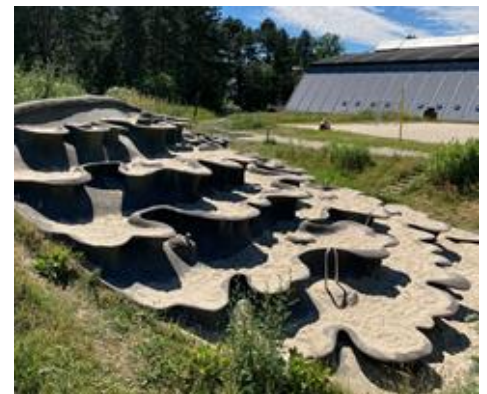
Figur 4: Vandlegepladsen.

Vandlegeplads: Vandlegepladsen er en kombination af vandlegeplads og regnvandsbassin, som renser regnvand til badevand via et biofilter (sandfilter og planter). Regnvandsbassinet er udformet som en sø, mens vandlegepladsen er udformet med en række skrå hylder samt pumper og gejsere, som kaster vand op i luften.