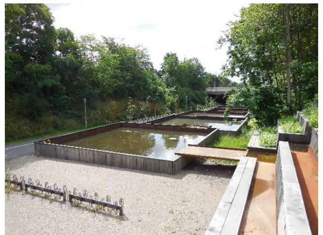
Figur 1: Vandledningsstien.

Idrætscenteret ved Gladsaxe Stadion ligger på toppen af et stort regionalt vandsystem. Den vandtekniske idé er derfor både at sikre selve idrætsanlægget mod flere oversvømmelser og at aflaste det øvrige vandsystem, som ligger nedstrøms i forhold til idrætsanlægget. Den nordlige del af idrætscenteret ligger topografisk højest. Fra bygningernes tage og de befæstede arealer opsamles regnvand i en række af forbundne regnvandsbassiner og kanaler på idrætsanlæggets område. Her opstaves