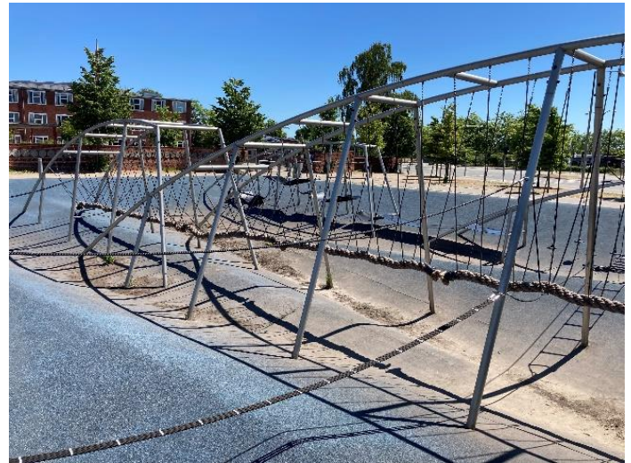
Figur 8: Pigeværelset.

Pigeværelset: Pigeværelset fungerer som et bassin og som et rekreativt opholds- og bevægelsesrum med særligt fokus på pigerne som målgruppe. Bassinet fyldes med vand i forbindelse med mindre og større regnhændelser, og derfor vil bassinets foldede bund ofte være delvist dækket af vand. Selve bassinet består af en in situ-støbt betonvæg og måler 25 x 25 meter. De forskellige klatre-, hænge- og kravlemuligheder kan fleksibelt flyttes rundt i en række høje, buede stålrørkonstruktioner på tværs af bassinet. Bassinets bund består af en tyk, blå gummibelægning, som danner bløde folder, der vil oversvømmes ved regn hændelser. Her bliver Pigeværelset derfor endnu mere udfordrende, da man kan få våde fødder, hvis ikke man holder fast og bliver hængende.