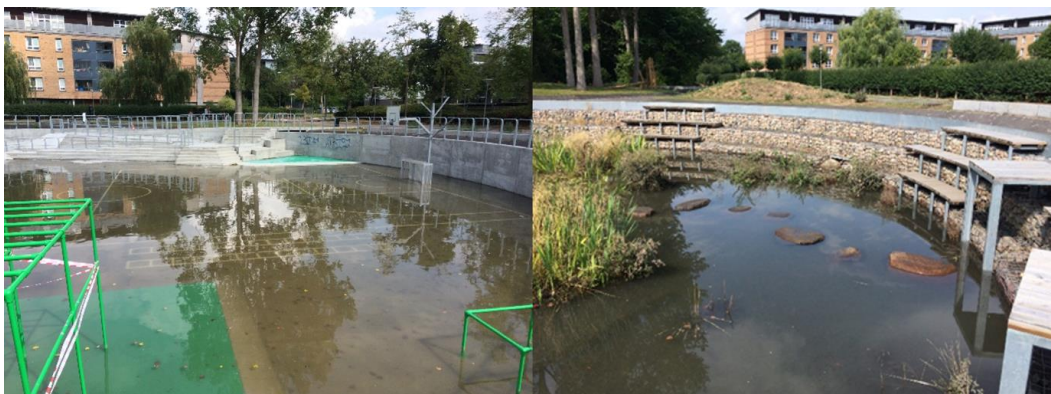
Figur 2: Vand i det store bassin (venstre) og lille bassin (højre).

Da bassinanlægget Kilen blev projekteret, var forventningen at det ville komme i brug et par gange om året. Det viste sig dog at det var teknisk problematisk og betydeligt omkostningsfuldt at få tilsluttet de vestligste beliggende boligområder (Klosterparken og Digeparken), da vandet her skulle føres under en tværgående hovedvej, hvor der i forvejen var anlagt en cykel- og gangtunnel med en hovedfjernvarmeledning. Der er derfor pt. kun tilsluttet boligområdet Elmelyparken på 4 hektar som er lidt under halvdelen af det projekterede regnvandsopland på 10 hektar. Der arbejdes dog fortsat på at få tilsluttet flere regnvandsoplande til Kilen – f.eks. den vestligste del af Solrød Centeret.