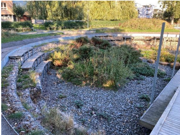
Figur 3: Lille bassin med planter, oktober 2021.

Det lille bassin er designet som et "grønt" regnbed hvor den oprindelige plan var at der skulle være varieret bevoksning af vand- og sumpplanter. Den oprindelige bevoksning har ændret sig, da der ikke har været budgetteret til vedligehold af specielle planter, dette har medført at der nu gror de planter, der har kunne etablere sig. Det er primært de planter der kræver sumpforhold, der er gået tabt, da regnbedet ikke har modtaget nok vand. På de grønne arealer rundt om anlægget blev der fra starten plantet forskellige planter, så arealet kunne få et særligt præg. Disse planter er forsvundet, og nu er det primært græs, som skal slå.